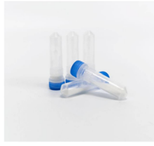
B 細菌適用 (#116911500)