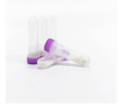
E 土壤適用 (#116914500)