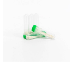
D 軟組織適用 (#116913500)